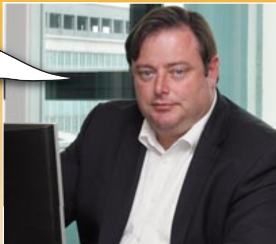
N-VA-VOORZITTER BART DE WEVER