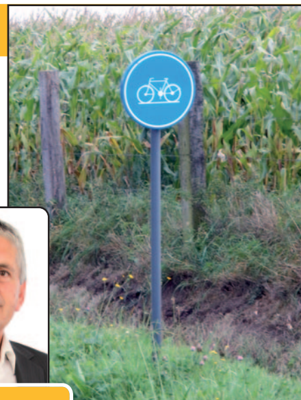
Onze fietspaden zouden veilig en goed onderhouden moeten zijn. Maar helaas ...